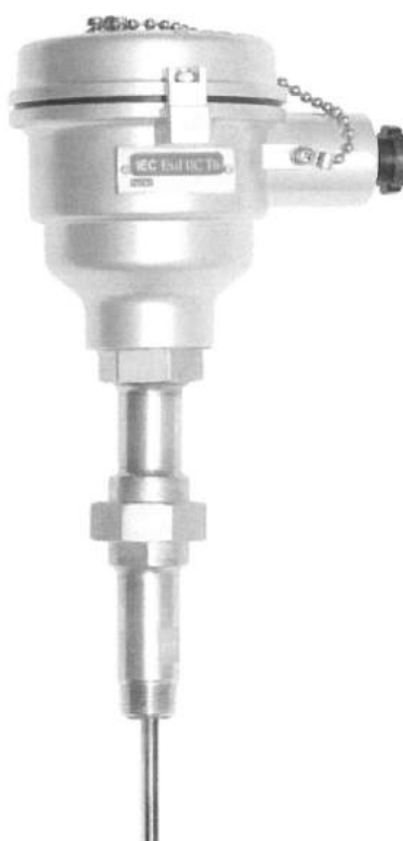
Рис.3 ТП модификаций R921, R922, R941, R942, R951, R952