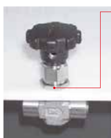
Гайка для крепления на панель